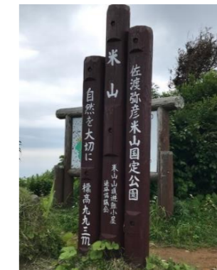
階段が続くコースも