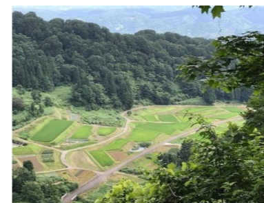
美しい棚田が広がる