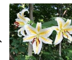
7月中旬はヤマユリ(柏崎市の花)が見ごろ

標高が低く、登山コースがとても豊富なため、大人から子供まで、気軽に楽しむことが出来ます。 各コースの詳細な情報が柏崎市HPに掲載されていますので、チェックしてみてくださいね。 不動滝(ふどうたき)、屏風滝(びょうぶたき)、十三ヶ滝(じゅうさがたき)も、訪れてみてください。