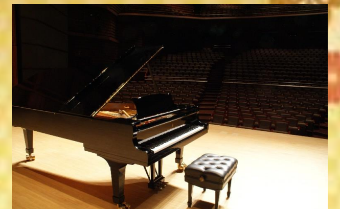
(スタインウェイピアノ)

◆その他 3歳未満入場不可 (3歳以上の未就学児はご入場いただけますが、他のお客様へのご迷惑になる場合はご退場をお願いいたします)