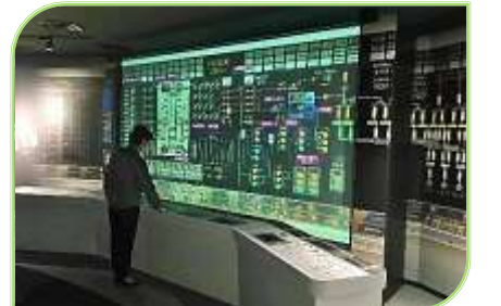
大画面で見る中央制御室緊急時対応訓練の様子は圧巻。