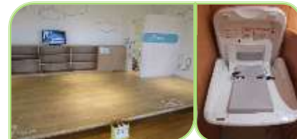
キレイな化粧室でオムツ交換もラクラク。男性用化粧室にもあるのでパパも安心。