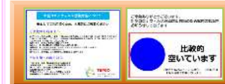
検温アラームシステム導入。徹底した管理が実施されていて安心。