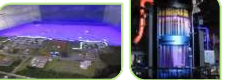
音声に動画と光の演出を組み合わせたプロジェクションマッピングで1/5 原子炉模型やジオラマを用いて具体的に説明。