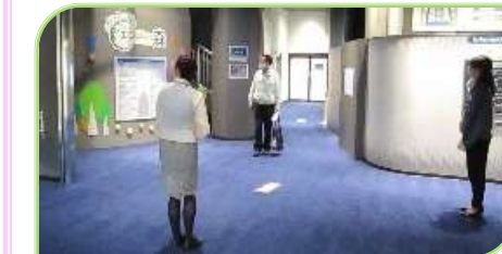
段差が無いので、足元を気にせず、車イスの方、小さなお子様の転倒も心配なし。各階エレベータ利用可能なので上下階の移動もラクラク。