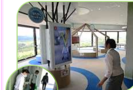
ゲーム感覚で楽しみながらエネルギーを体感。