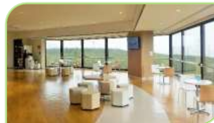
明るく広々とした眺望の良いつろぎ空間。